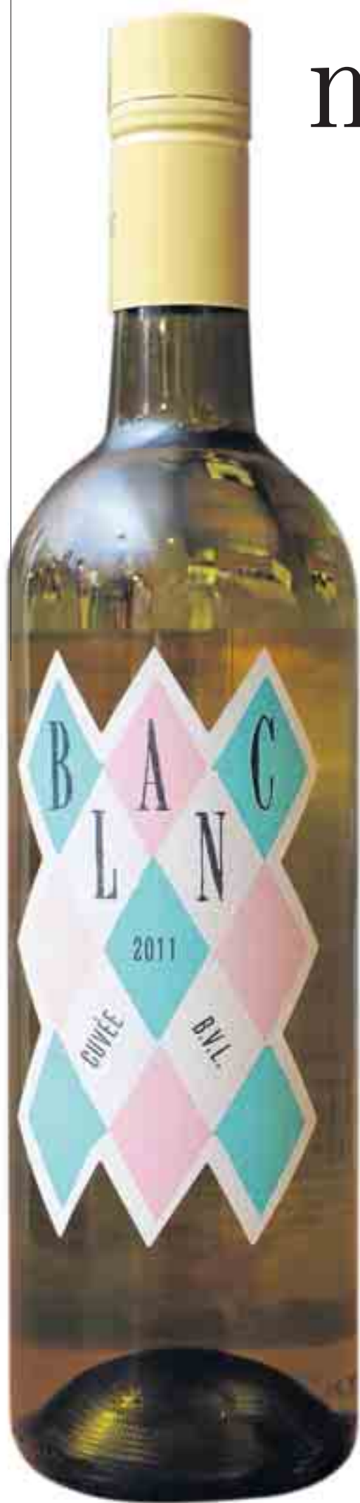
De Cuvée B.V.L.

Das Pop heeft een nieuwe single, maar u kan Bent Van Looy vanaf deze week ook proeven als een witte wijn. Daarmee is hij niet de eerste artiest die zijn naam en passie linkt aan de vineuze geneugten.