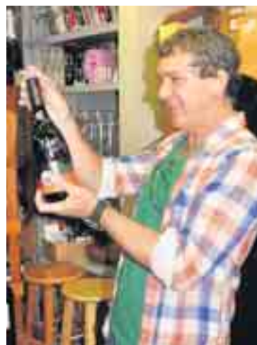
Antonio Banderas.