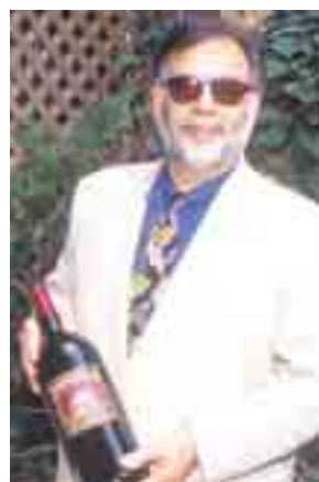
Francis Ford Coppola.