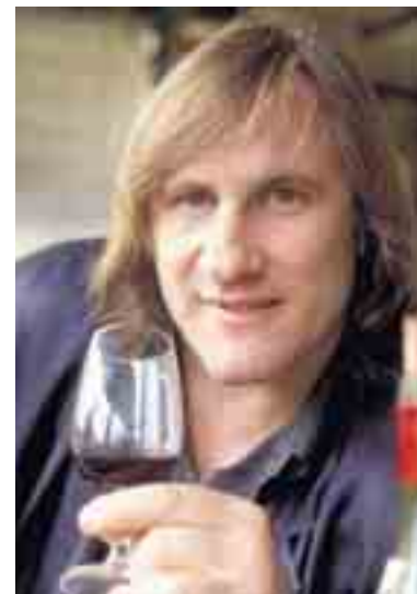
Gérard Depardieu.